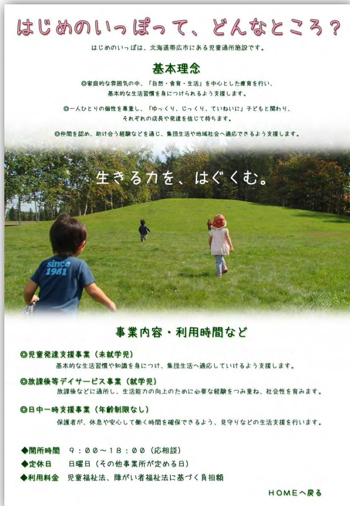
いっぼの基本情報を掲載するページです。