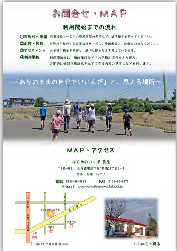
いっぼの利用方法や地図を掲載するページです。