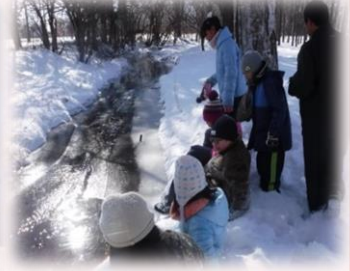
夏のザリガニは どこ行ったのかな?