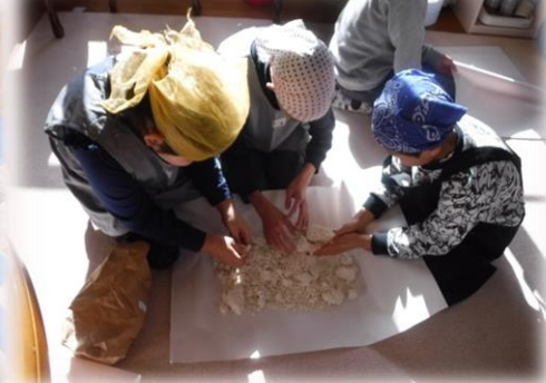
麴のいい匂いが漂います