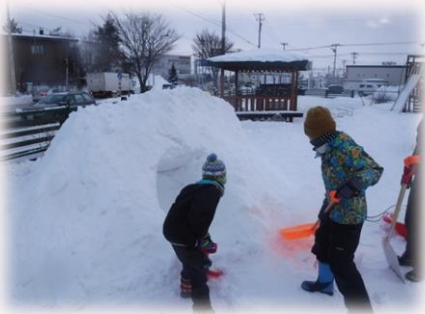
「入り口はこっちに作ろう」

また、「僕、明日休みだから〇〇君、頼むよ!!」「わかった、〇〇君の分頑張るんだ!」と友達同士の関わり・絆の深さを改めて感じております。