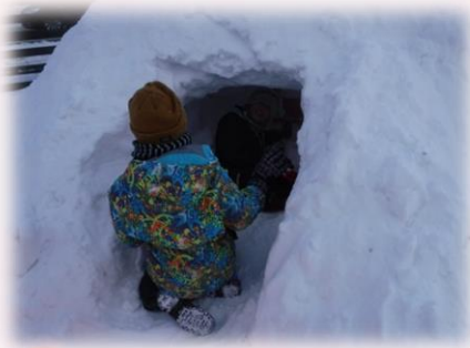
「壁の厚さよさそうだね」