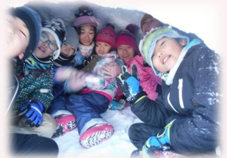
完成したかまくら10人のお友達入居