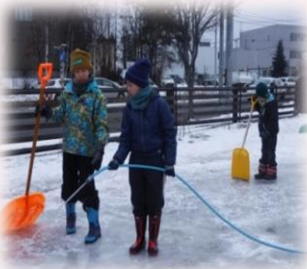
寒い中でのリンク作り

何よりもコツコツ積み重ねた経験は、大きな自信につながっていると子どもたちより学んでいます。