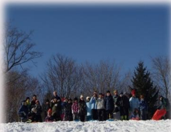
青空の下 みんなでソリ滑り