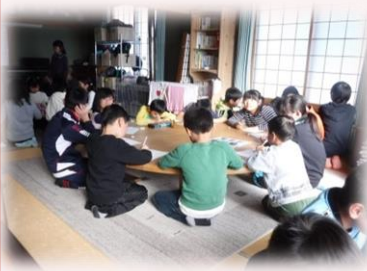
素敵な誕生カード作り

創作人形劇やお友達誕生カード制作など「静の活動」と「動の活動」のバランスを考慮し、時間を大切にしながら行動（考動）しておりますのでご安心ください。