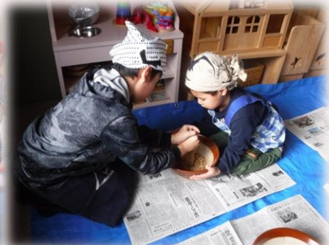
仲間と協力するから楽しいんだ！