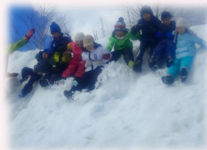
「いくぞー! せーの」友達と一緒になら、怖くない