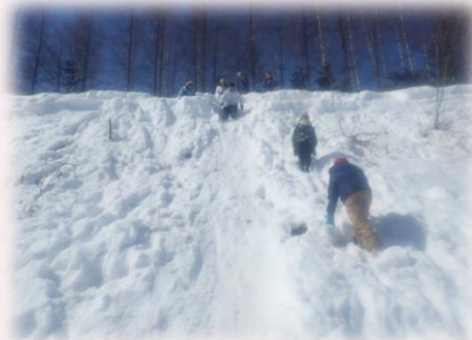
2階建ての建物ほどの急な崖登りこのスリルがたまりません。