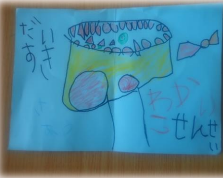
〇〇ちゃんの、ケーキの絵

子どもたちの顔が見られない、声が聞こえない静寂した空気が心まで閉ざされふさぎこんでいた時、4才の女の子がお母さんと一緒にメッセージカードを届けてくれました。