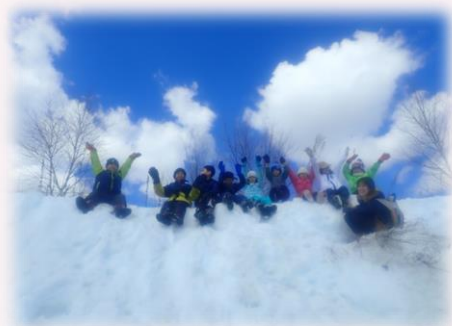
青空と素敵な自然