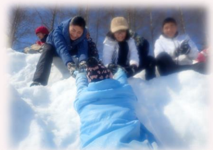
「がんばれー」足を滑らすと下まで真っ逆さま