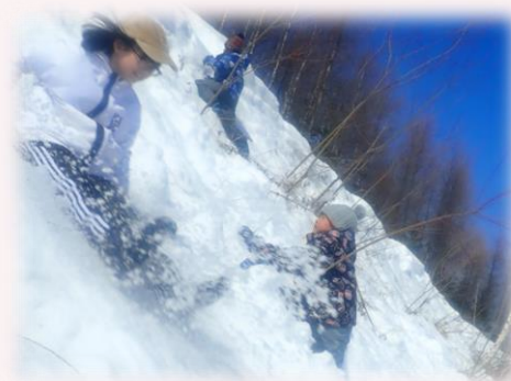
全身を使って・心から弾けました。