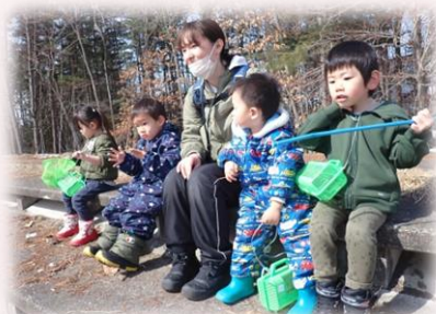
春を見つけることが出来たかな？

3月上旬は、雪山登ってハイポーズ！でしたが20日ころには、ポカポカ日差しの中、虫かごさげて河川敷へ春を探しに散策と、北海道の春は駆け足でやってきます。おひさまの力はすごいなと、つくづく実感します。のんびりと歩いているといろいろな発見がありますが、休憩時間も子どもにとっては遊び時間の延長で対話を求めているようです。