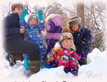
みんなで登った雪山には雪がいっぱいありました。