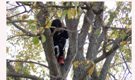
竹渡りも、木登りも仲間とともに切磋琢磨しています。