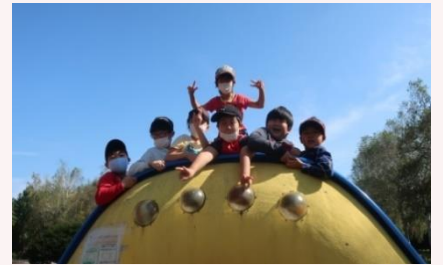
一息つく癒しの時間も大切！