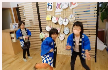
「おめんはいかがですか～」