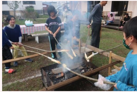
秋の恒例行事、棒パン作り