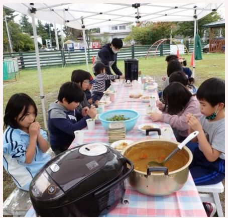
みんなで食べるはずだった まつりのお昼ごはん