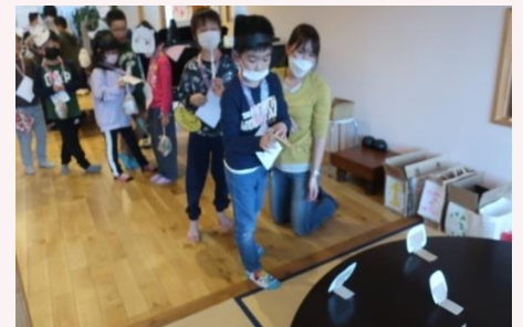
ゴムでっぼうのしゃてき 大人気でした