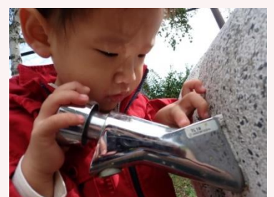
一度集中し始めると、とまりません！