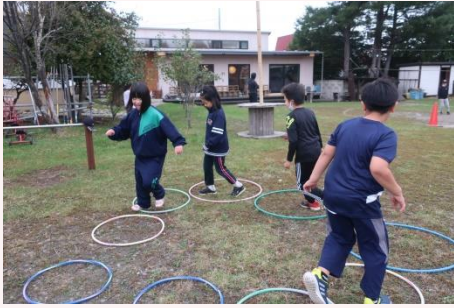
あそびの輪が広がる仲間たち