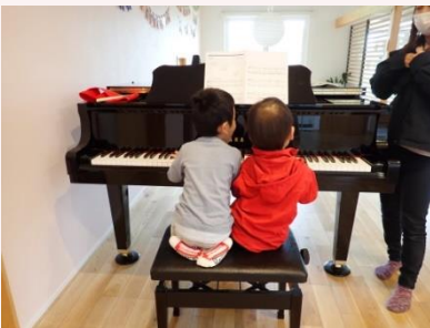
仲間がいるから楽しい！