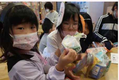
くじ・しゃてき・おかしつり 景品いっぱいGET!

「げんきいっぱい、はじけよう！」をテーマに、今月8日“いっぽまつり”を開催予定で、みんなで準備に取り組んでできました。また、参加申し込みも当初予定の60人を大幅に超え121人の申し込みとなり、子どもたちと大いに喜んでいました。ところが当日は雨！ 予定の60人程度であれば、結の中で決行と決めておりましたが、さすがに120人を建物の中では無理と判断し、中止とさせていただきます。楽しみにしていた子どもたちと保護者の皆様には申し訳なく、ここでお詫び申し上げます。