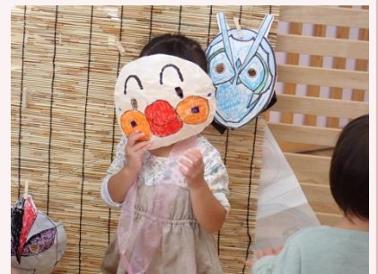
おめん屋さんで GET! 「わたしはだれでしょう？」