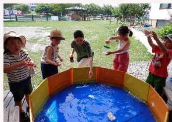
みんなでお魚釣り♪