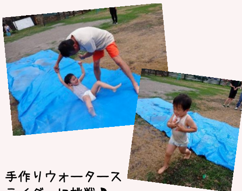
手作りウォーターズ ライダーに挑戦♪